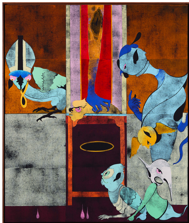
© Gert & Uwe Tobias, Random Rules, 2021 (détail)

La Fondation Louis Roederer soutient activement la création contemporaine et la transmission des connaissances. Elle investit autant les arts que la recherche, elle célèbre la pensée et le geste, elle explore ce qu'universellement nous partageons: le mot, la note et l'image au travers de la littérature, de la musique, des arts vivants, des arts visuels et plastiques. Au cœur de ses soutiens et actions, elle permet la rencontre de la création et de la connaissance, génère des ponts et des résonances.