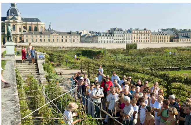
Domaine du Rayol

Nous avons souhaité que le programme Thinking Sustainability franchisse une nouvelle étape en 2026, en s'enrichissant de deux volets complémentaires, à la fois réflexifs et engagés.