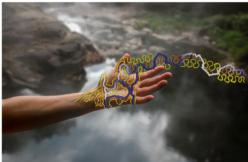
© Ana Elisa Sotelo & Sadith Silvano, Petition to the plant spirits, Portraits of the Multiverse

Créé en 2024, Thinking Sustainability marque une étape décisive dans l'engagement de la Fondation Louis Roederer. Conçu pour éclairer les enjeux environnementaux, culturels et sociétaux contemporains, ce programme international biennal permet à la Fondation de franchir un cap symbolique: passer d'un mécénat de soutien à un mécénat d'action, en se positionnant comme un acteur culturel à part entière.