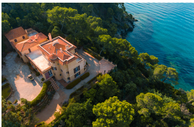
World Monuments Fund